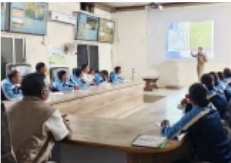
Forest Guard Foundation Batch visited Bor Tiger Reserve to study wildlife rescue management, wireless systems at Bor Tiger Reserve