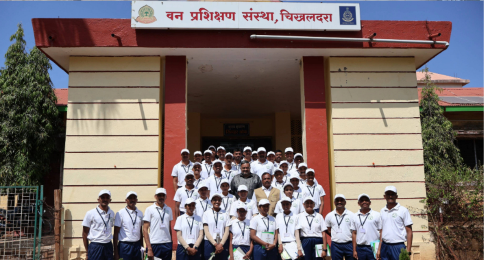
Forest Guard Foundation Batch Visited Jalna And Chikhaldara Forest Training Institutes