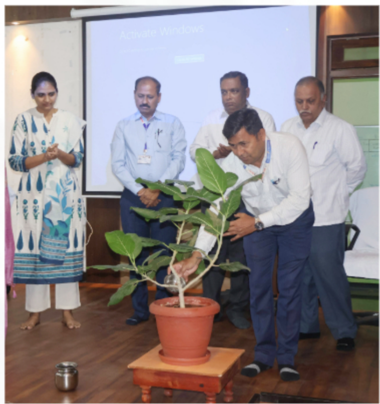
RATI Refresher Batch Group C