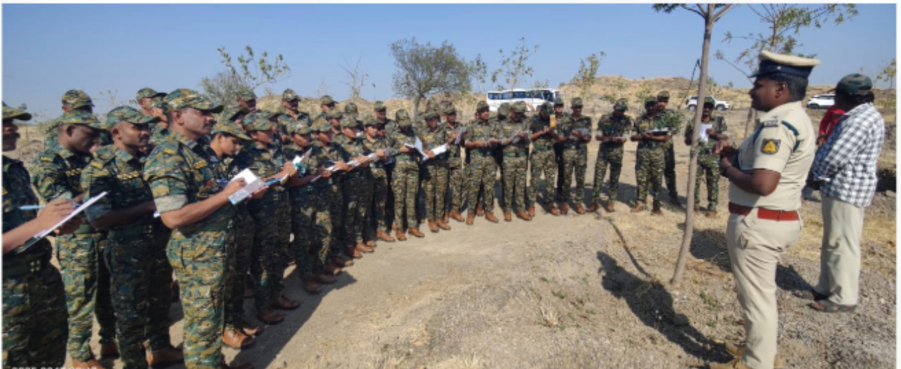
Visit to Tall Plant Nursery at Bijargi, Karnataka