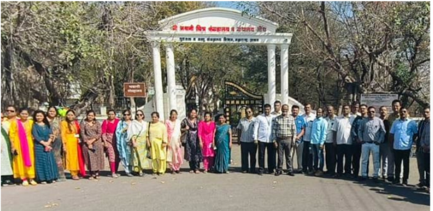
Tour Aundh Historical Museum RATI Foundation & Post Promotional Batch