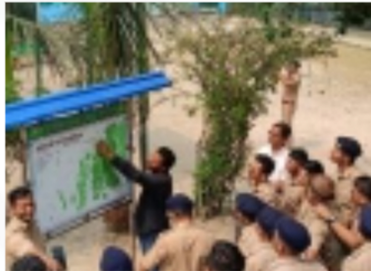
Visit To Sundarban Tiger Reserve