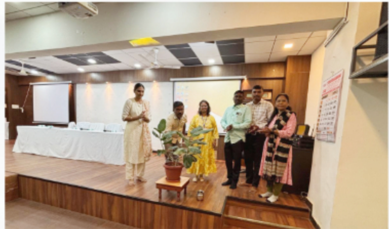
RATI Foundation Batch Group C