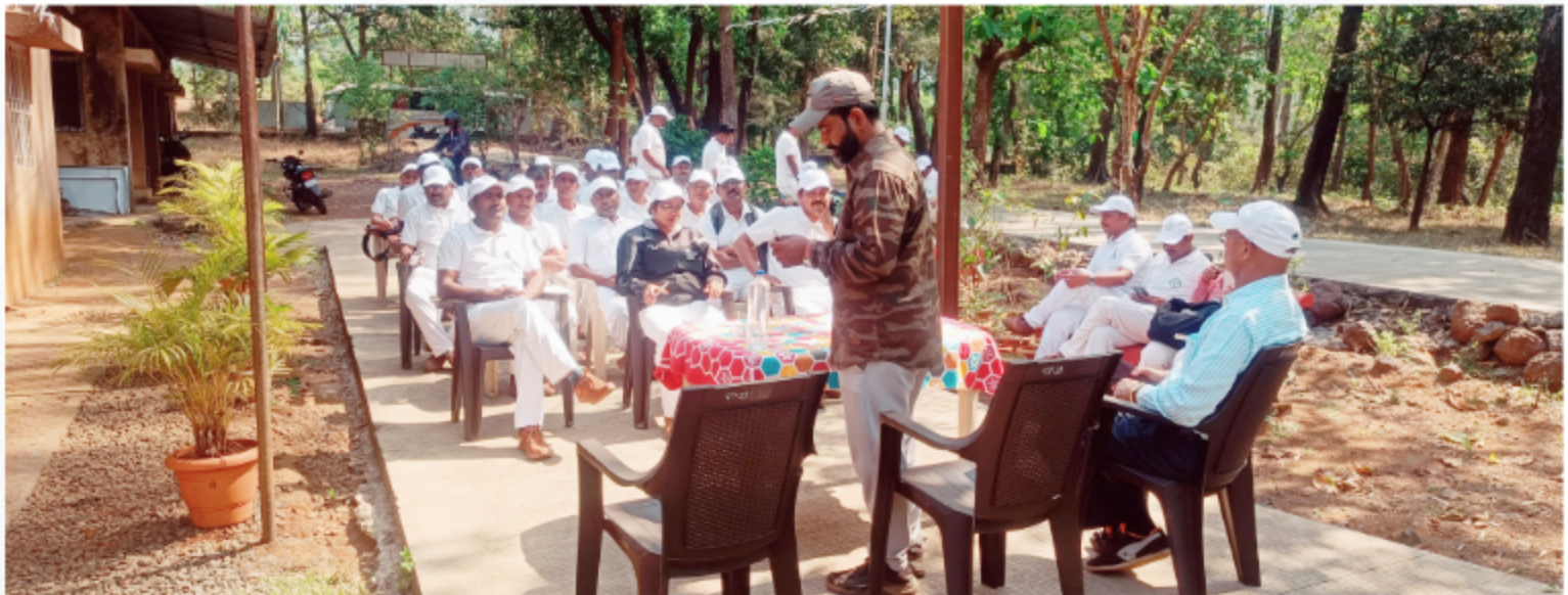
Forest Guard Foundation Batch at Koyana Wildlife Sanctuary To Study Animal Sign Survey & Nature Interpretation Centre