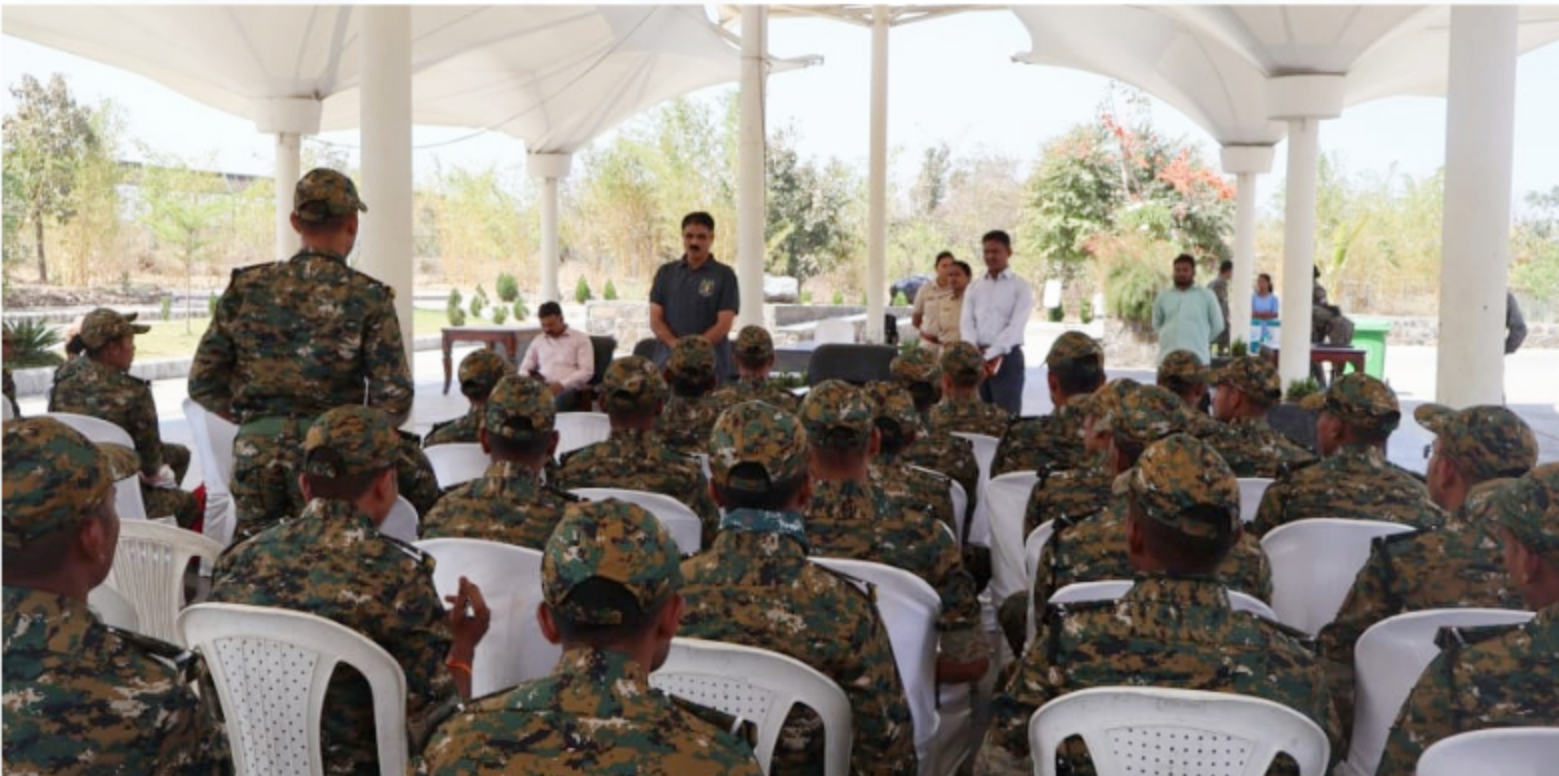
Forest Guard Foundation Batch visited Gorewada Zoo, Nagpur to study zoo management and wild animal treatment centre