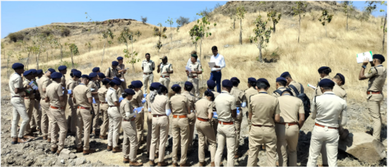
Visit to Tall Plants Plantation Site, Kanamadi, Karnataka