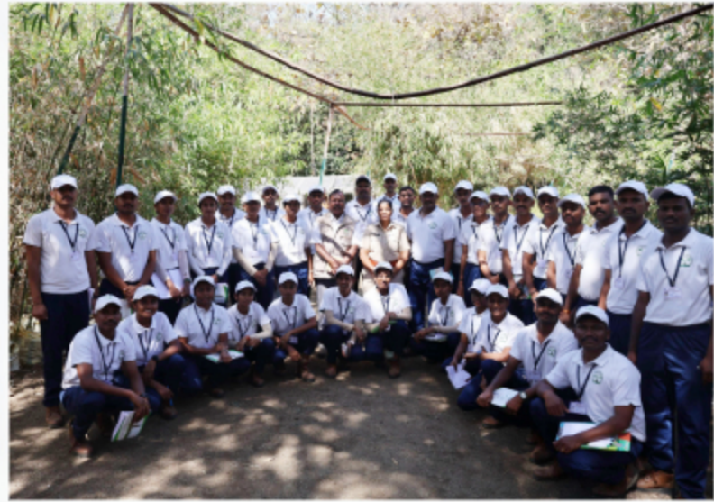
Forest Guard Batch Visited Vadali Bamboo Chetana Kendra, Amravati To Study Bamboo Plantation, Bamboo Nursery Techniques