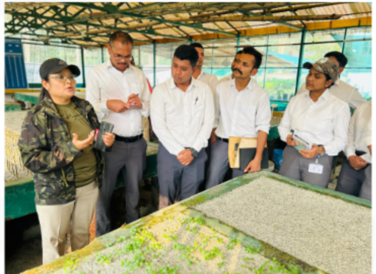
Visit at Sukana