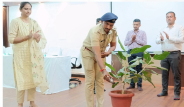
Forester 74th Batch