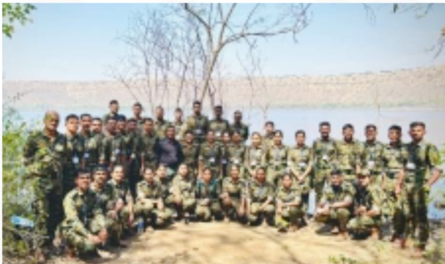
Forest Guard Foundation Batch visited Lonar Crater to study Crater ecosystem and Ramsar Site Management