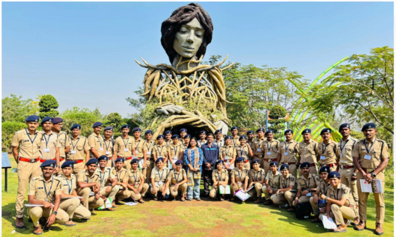
Visit to Shradheya Shri Atal Bihari Vajpayee Botanical Garden, Visapur to Study Conservation Zone Nurturing techniques for Indigenous Flora and Fauna