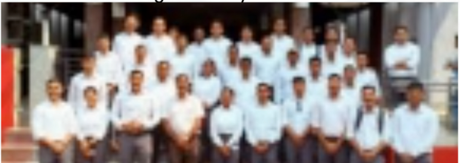
RFO BATCH 2024-25 NORTH EAST TOUR