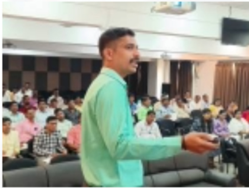
RATI Foundation and Post Promotional Batch Group C (10 Feb to 21 Feb)