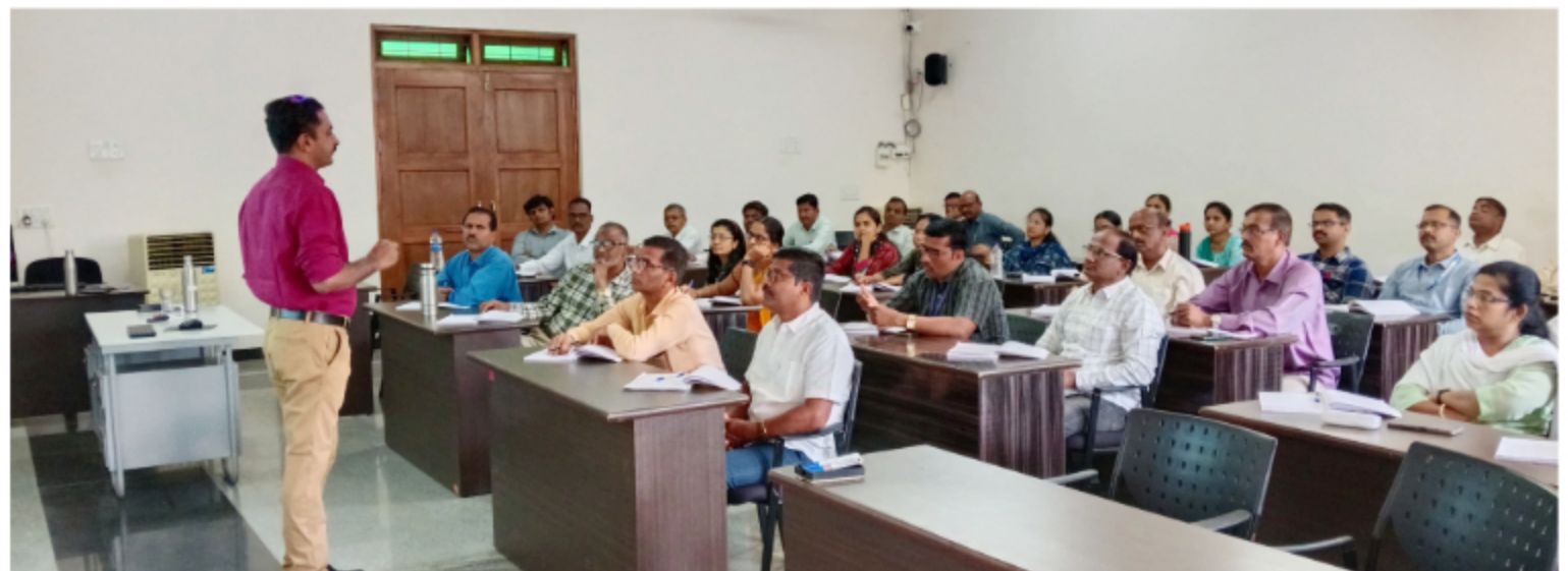
RATI Foundation & Post Promotional Batch (Date 27 Jan to 7 Feb 2025)