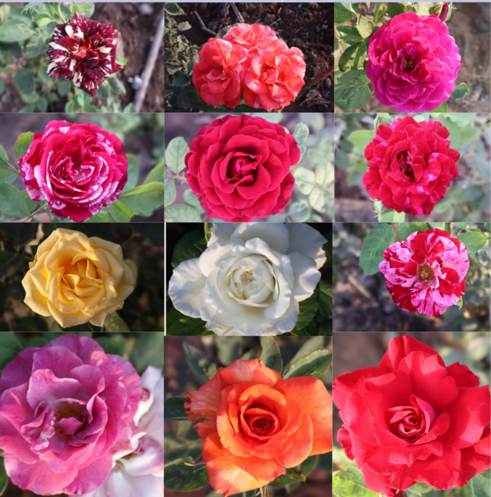
1. Abra Ka Dabra 2. The Painter 3. Eddy Mitchell 4. Bordo, 5. Eco Talk, 6. Solaire, 7. White Avalanche, 8. White Avalanche, 9. Shiun, 10. Shiun, 11. Marvelle, 12. Marvelle