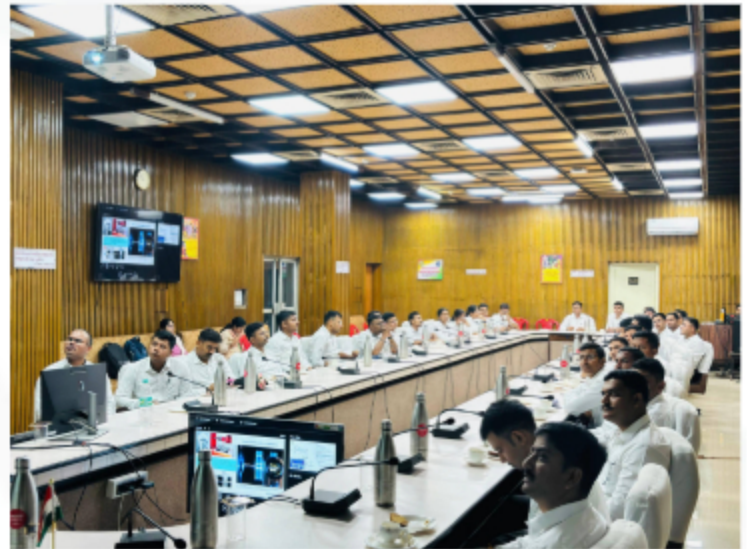
Geological Survey Of India