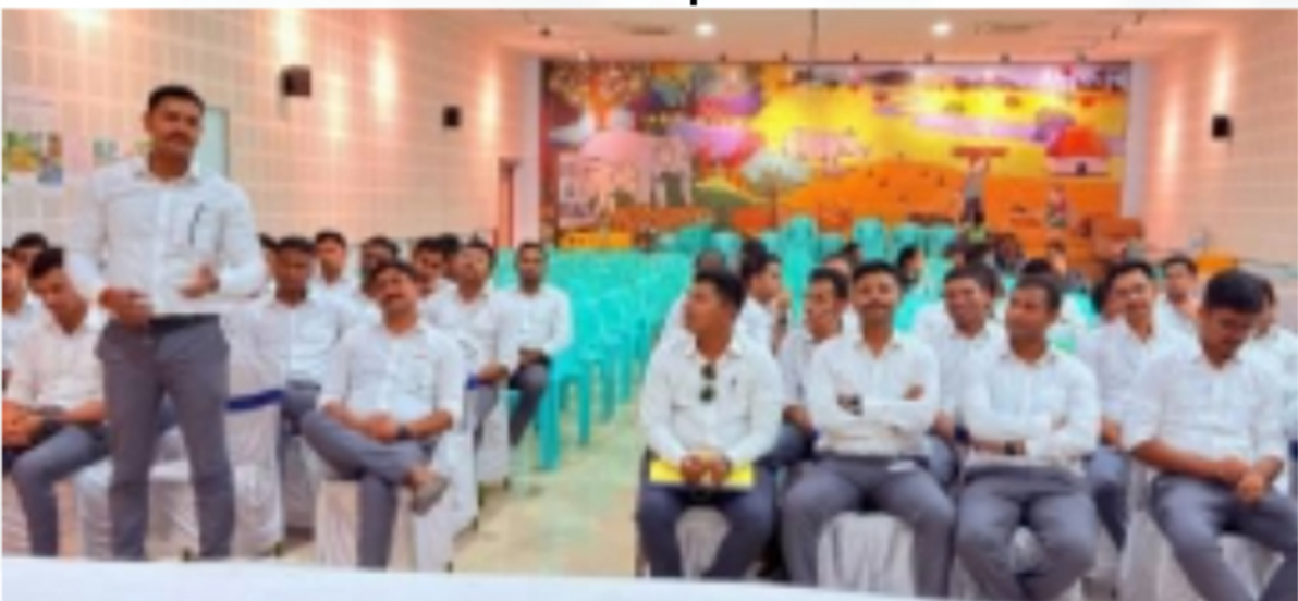
RFO BATCH 2024-25 NORTH EAST TOUR