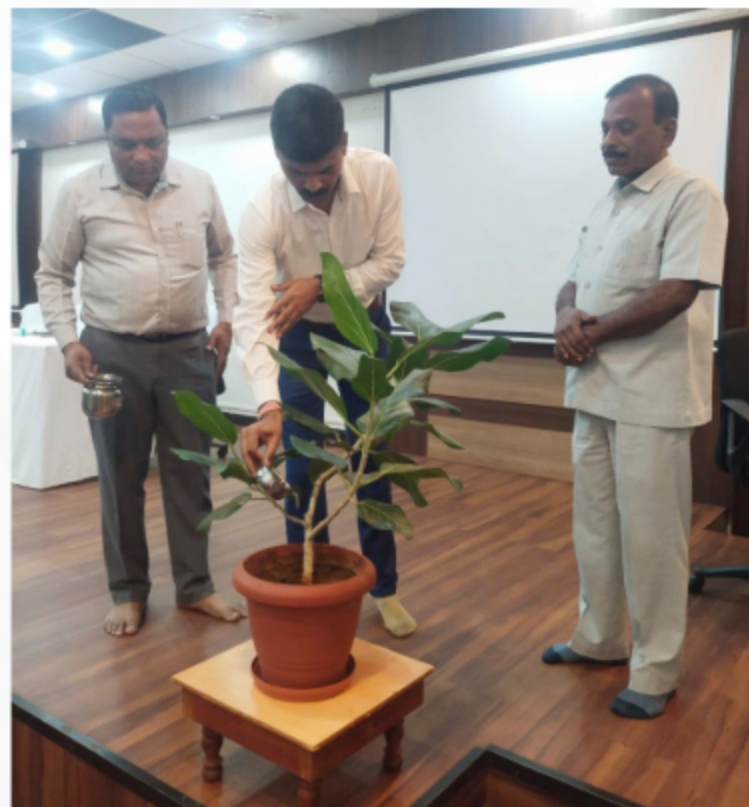
RATI Foundation Batch Group C