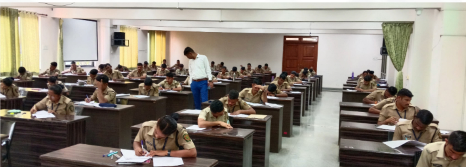
Forest Guard Examinations