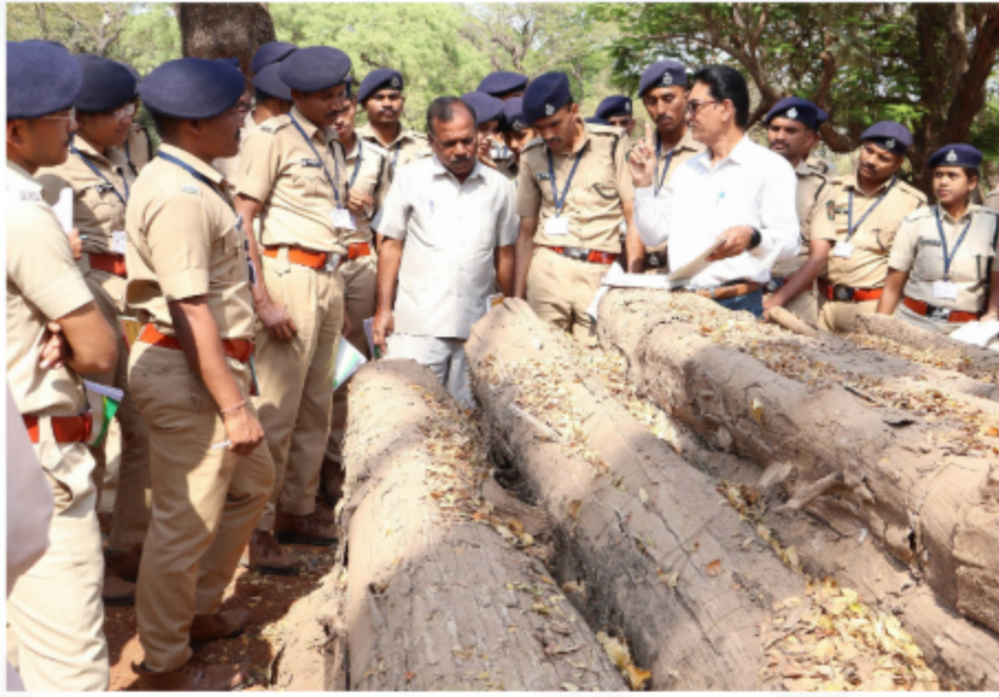
Visit To Ballarshah Timber Depot to Study various Timber Registers, Timber Grading, measurements, Stacking, Lotting, E- Auction Process etc