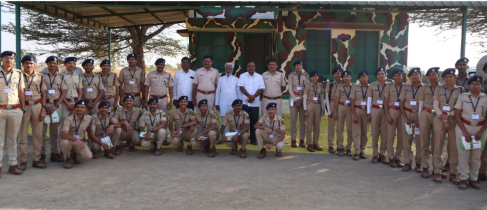
Forest Guard Foundation Batch Visited Kadabanwadi village in Indapur Taluka to Study Grassland management and working of JFM committee