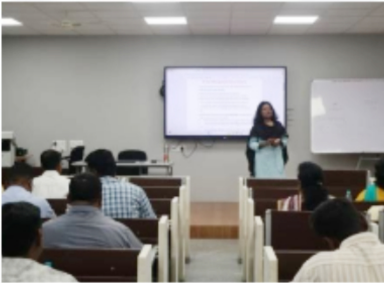
Balbharti Pune, Refresher Batch (20 Feb to 24 Feb)