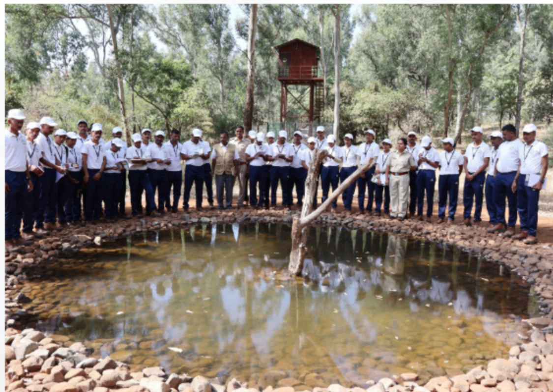
Forest Guard Foundation Batch visited Melghat Tiger Reserve to study Wildlife Management, waterhole management, Ecotourism Activities etc.